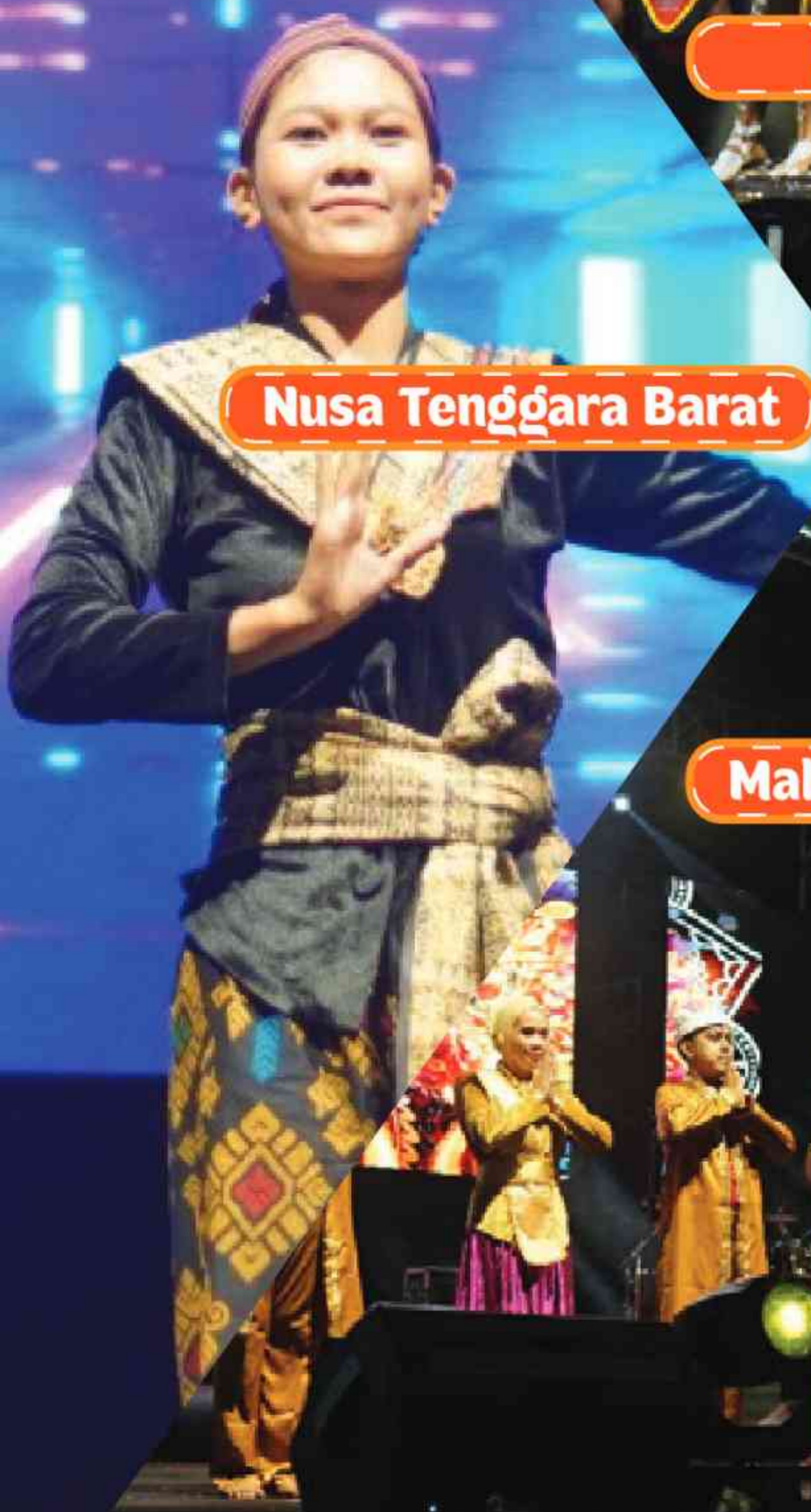
Nusa Tenggara Barat